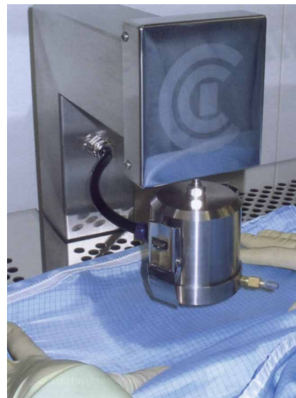
Рис. 2: Измерительная головка и одновременно зажимное приспособление: на стол кладется предмет одежды, с помощью педального выключателя замыкается измерительная головка и начинается процесс подсчета

Наличие определенного спроса со стороны промышленных предприятий привело к тому, что институт ITV Denkendorf и фирма CCI совместно разработали усовершенствованный испытательный стол, который дополнительно к уже упомянутым преимуществам обладает возможностью удобно и без складок натянуть испытуемую поверхность с помощью пневматического регулирования ножной педалью. Имеется также программное обеспечение для передачи данных измерения со счетчика на компьютер и обработки данных измерения.