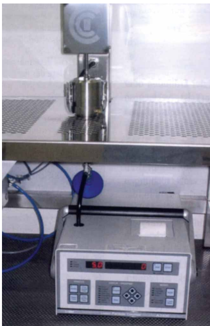
Рис. 1: Общий вид испытательного стола ITV-CCI со счетчиком частиц

5,0 мкм (не приравнивать эти классы к классам чистоты воздуха).